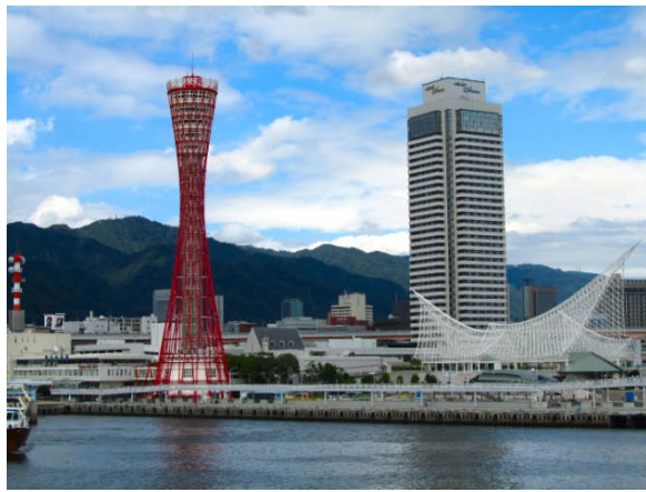
同じくハーバーランド（モザイク）側から