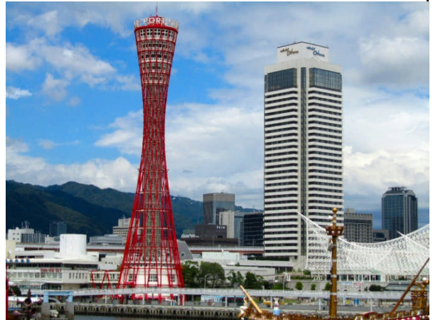
遊覧船乗り場をはさんでモザイク（南西）側