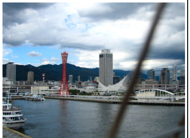
窓には網があるので写らないようよける。