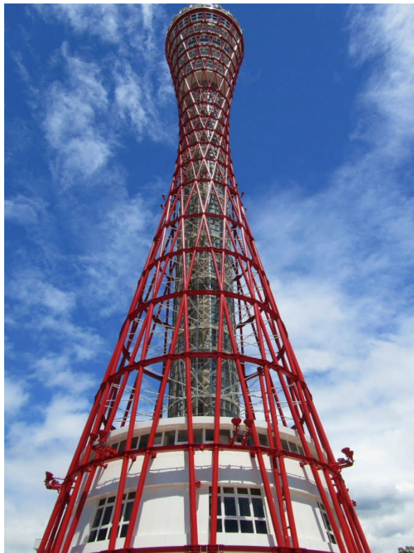
南側近くから。1階入り口前から見上げる。