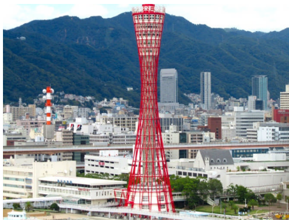
同じく観覧車から。