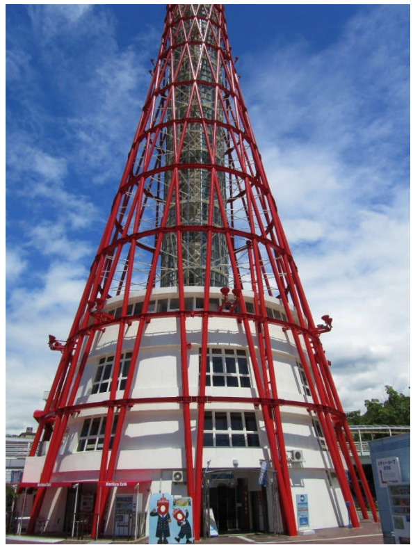
同じく南側の1階入り口前から。