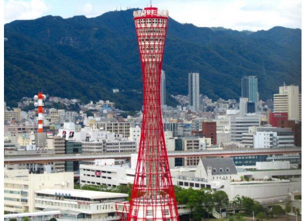
モザイクの観覧車から。ほぼ中央部分の高さ。