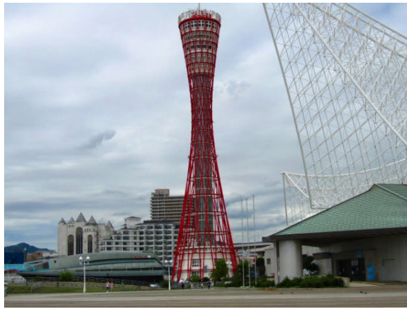
神戸港のメリケンパーク（東）側から