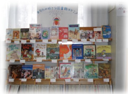
テーマで展示をしている。「子どものアンテナに引っかかってくれるか