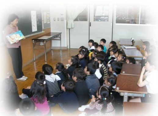
1年生の教室へ出前読み聞か