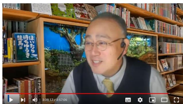
令和4年度文科省事業報告会「みんなで使おう！学校図書館vol.14」アーカイブ

長谷川： はい。「編集された」図書館 です。海洋堂のジオラマですよね。逆 に、NDC ではない。私はどちらか と 言えば、やはり日本十進分類法の自 由さが好きです。知の体系が、巨人 たち がきちんと成立しているという状 態が好きなんです。ただ、学校図書館 の 場合は確かにクローズな図書館な