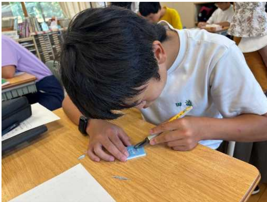
篆書体をトレースし消しゴムの篆刻を カッターで彫りました。