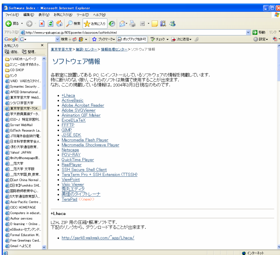
図 1 学芸大学ソフトウェア情報